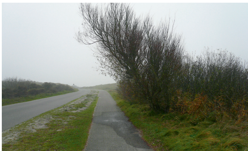
Figuur 1 Bosje op de Heereweg ('Badweg') vlak bij Midsland aan Zee op Terschelling, gefotografeerd in de herfst na een mistsituatie met wat wind. Let op de natte plek onder het (kale) struikje. Foto: G.P. Können, 9 november 2011.

Verwant met de 'regen onder de boom' is het welbekende onaangename verschijnsel van 'de natte fietser in de mist': terwijl de straat vrijwel droog is